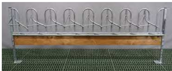
Fang.-Fressgitter für Ziegen & Schafe

auch als Melkstand mit Kaskadenprinzip Fertigung per laufender Meter nach ihren Wünschen individuell bei Tierabstand und Halsweite