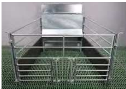
Futterautomat für Lämmer mit Schlupf