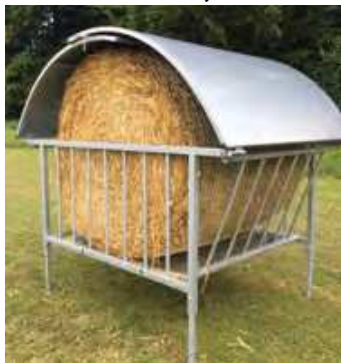
Rundballenraufe mit Dach für Ballen bis 1,65m